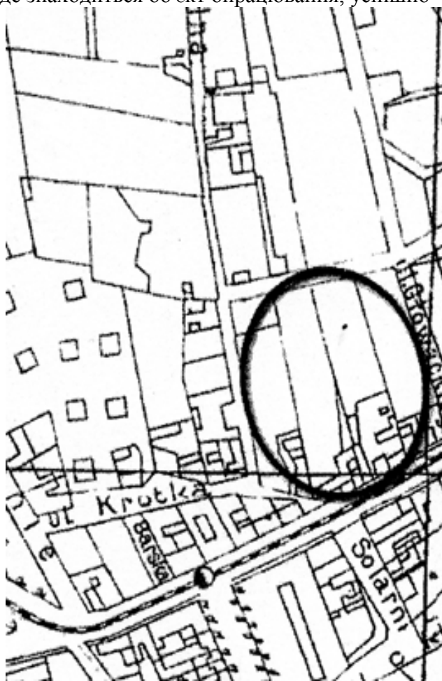
Фрагмент карти Львова 1890р.

На цій частині давнього Городоцького шляху, який, власне й носив цю назву, і знаходиться об'єкт опрацювання, присутні найбільш репрезентативні споруди вулиці.