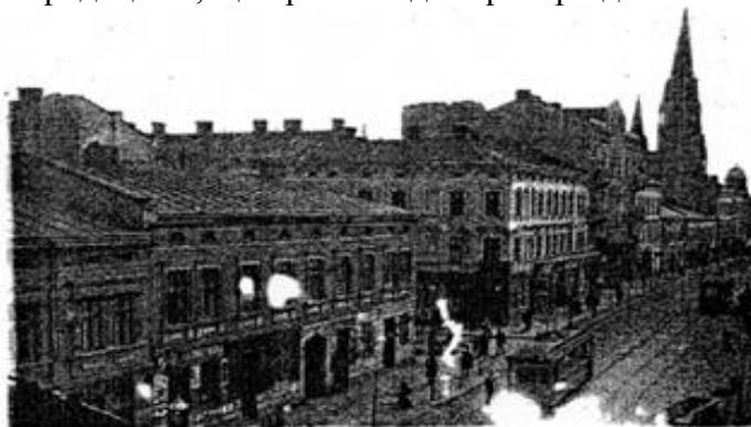
Горішня Городоцька поч. XX ст..

Безперечною домінантою відтинку вулиці Городоцької, що прилягає до території ділянки опрацювання, є костел (а нині церква) Єлизавети, який височить на розі вулиць Городоцької - Бандери, на межі головної Європейського вододілу. Як було зазначено вище, храм виник на місці колишніх артилерійських складів, в яких пізніше розмістилися соляні склади, що й дали сучасній площі Кропивницького тогочасну назву - і Солярні (згодом - пляц Більчевського).